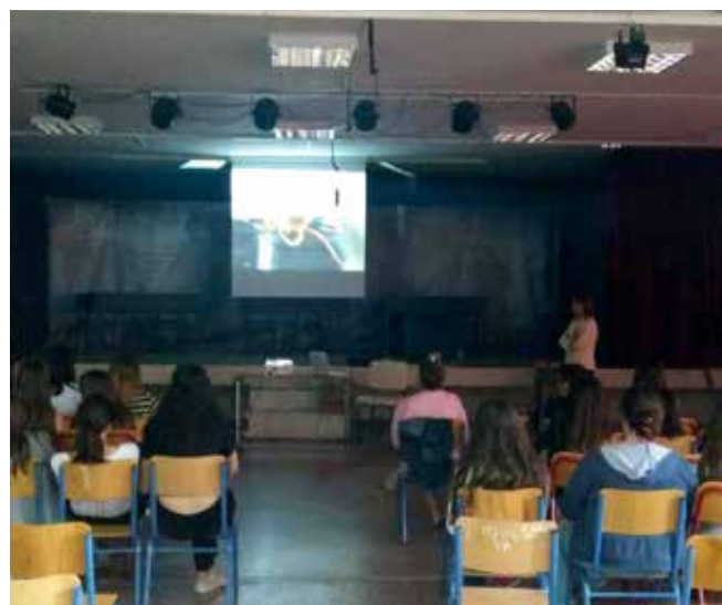
1ο ΛΥΚΕΙΟ ΖΩΓΡΑΦΟΥ