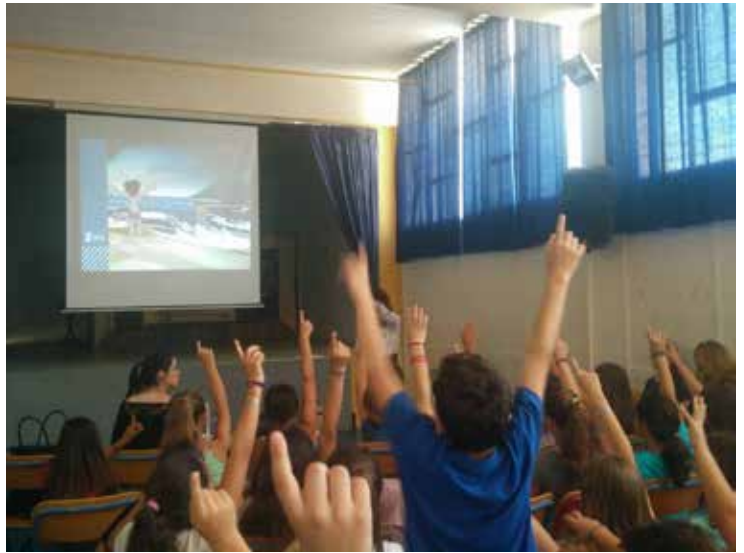
5ο ΔΗΜΟΤΙΚΟ ΣΧΟΛΕΙΟ ΗΡΑΚΛΕΙΟΥ