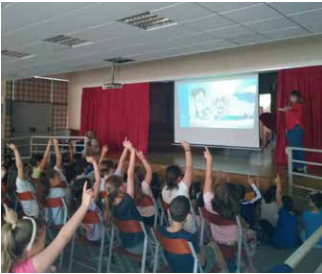
Το ΔΗΜΟΤΙΚΟ ΑΓΙΩΝ ΑΝΑΡΓΥΡΩΝ