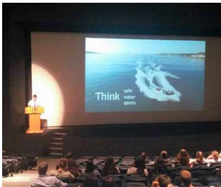
ΛΥΚΕΙΟ ΚΟΛΛΕΓΙΟΥ ΨΥΧΙΚΟΥ