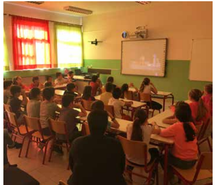
6ο ΔΗΜΟΤΙΚΟ ΣΧΟΛΕΙΟ ΑΡΓΟΣΤΟΛΙΟΥ