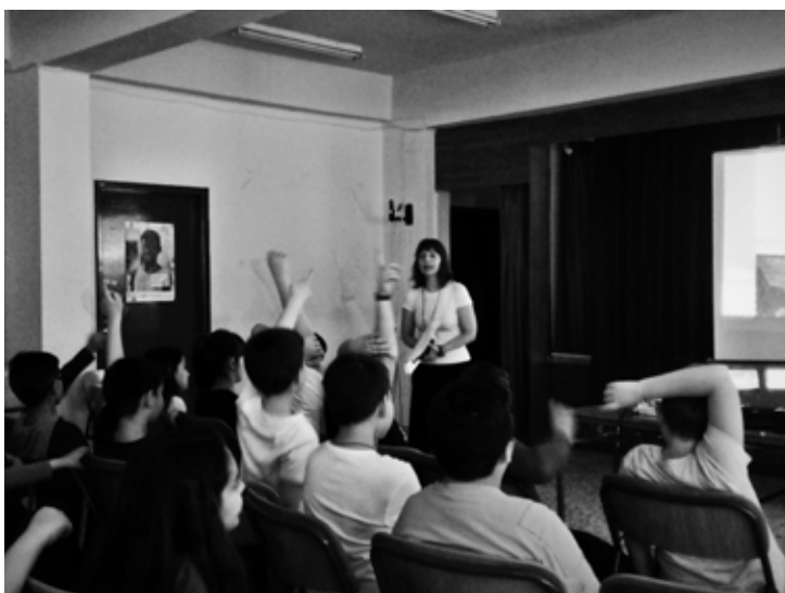
12ο ΔΗΜΟΤΙΚΟ ΣΧΟΛΕΙΟ ΑΧΑΡΝΩΝ ΜΕΝΙΔΙ