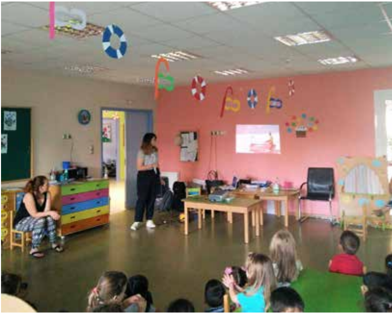
ΔΗΜΟΤΙΚΟΣ ΠΑΙΔΙΚΟΣ ΣΤΑΘΜΟΣ ΡΑΦΗΝΑΣ