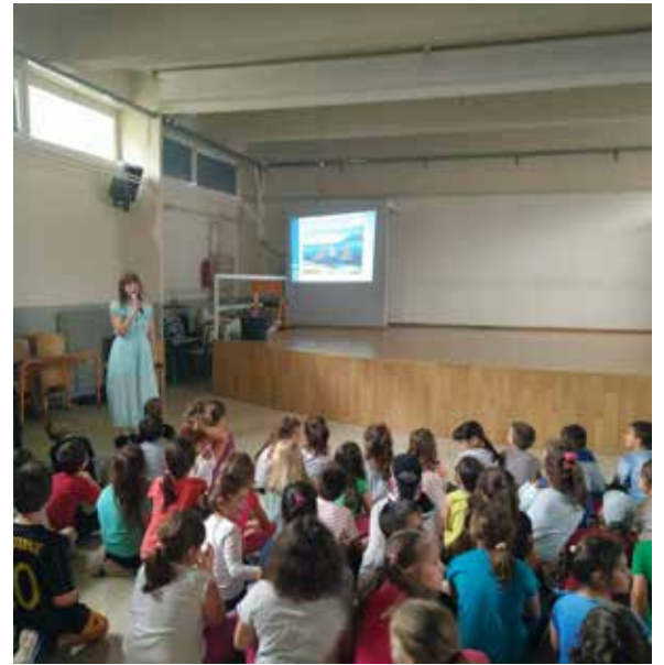
3ο & 11ο ΔΗΜΟΤΙΚΟ ΑΜΑΡΟΥΣΙΟΥ