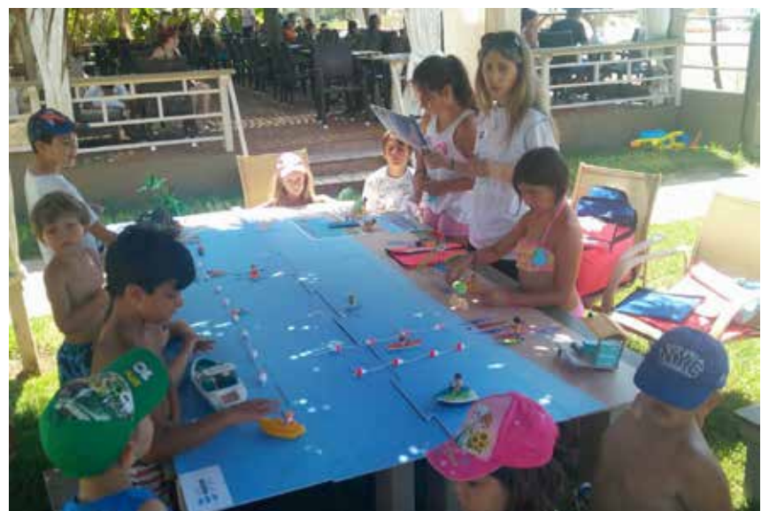
ΣΥΛΛΟΓΟΣ ΓΥΝΑΙΚΩΝ & ΜΗΤΕΡΩΝ ΜΥΡΣΗΝΗΣ ΔΗΜΟΣ ΑΝΔΡΑΒΙΔΑΣ- ΚΥΛΛΗΝΗΣ