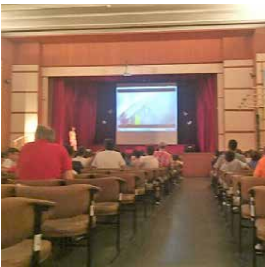
ΛΕΟΝΤΕΙΟΣ ΝΕΑΣ ΣΜΥΡΝΗΣ