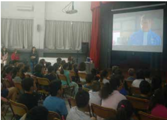
5ο ΔΗΜΟΤΙΚΟ ΣΧΟΛΕΙΟ ΚΗΦΙΣΙΑΣ