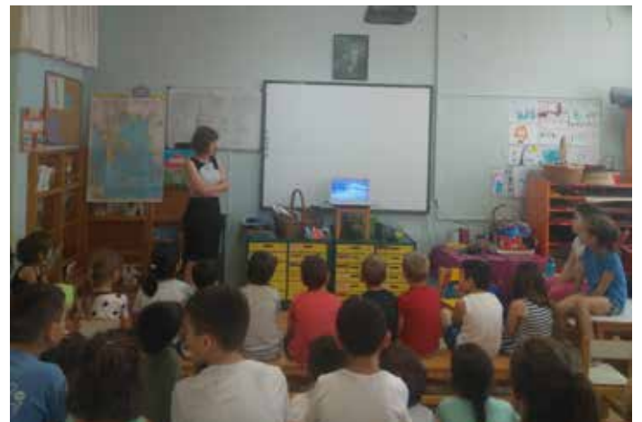
12ο ΝΗΠΙΑΓΩΓΕΙΟ ΜΑΡΟΥΣΙ