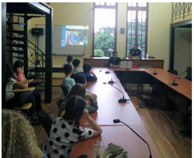
ΑΘΛΗΤΙΚΟΣ ΟΜΙΛΟΣ ΑΡΙΣΤΩΝ ΠΑΙΑΝΙΑΣ