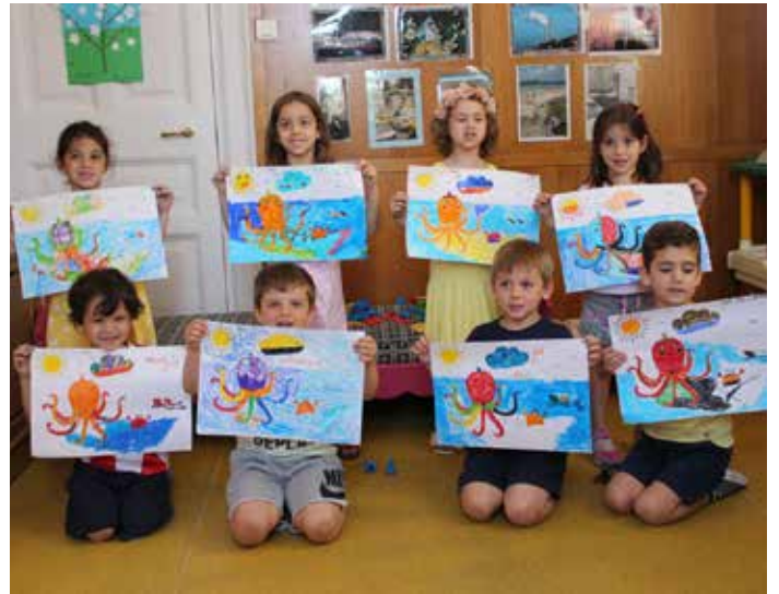
ΝΗΠΙΑΚΟ ΚΕΝΤΡΟ ΜΠΩΝΤΕΝ