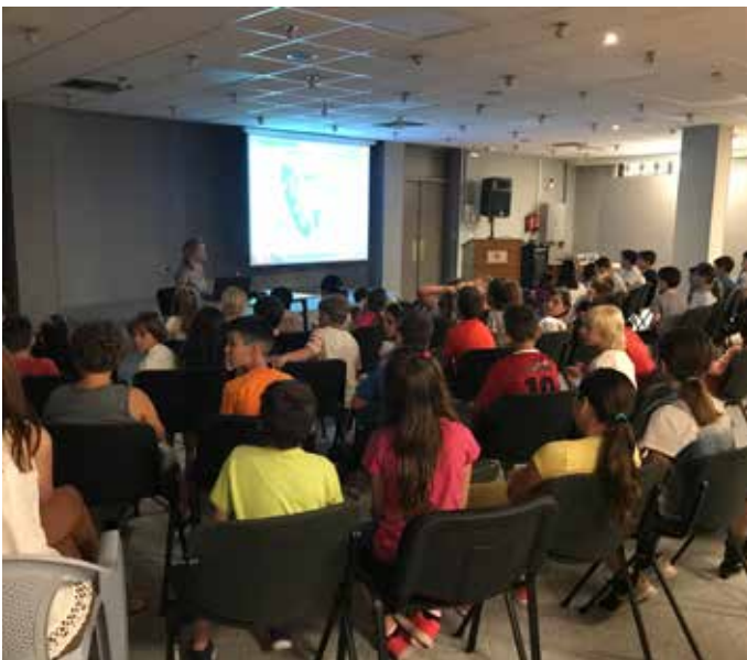
ΔΗΜΟΤΙΚΟ ΚΕΦΑΛΟΥ ΚΕΦΑΛΛΗΝΙΑΣ