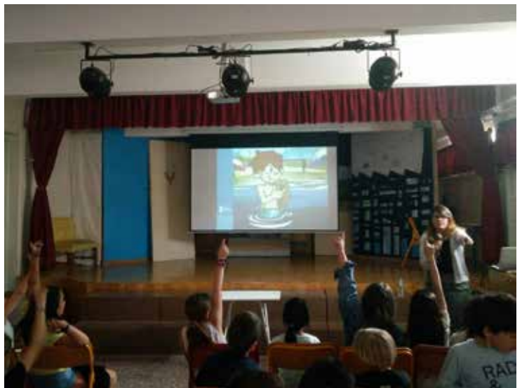
7ο ΔΗΜΟΤΙΚΟ ΣΧΟΛΕΙΟ ΠΟΛΙΤΕΙΑΣ