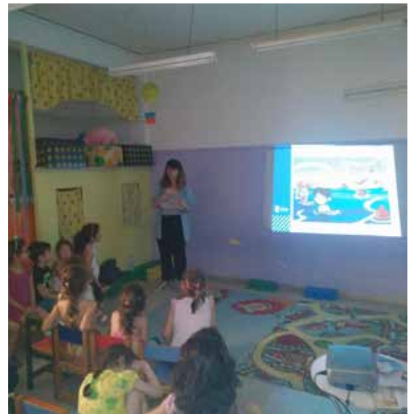
6ο ΝΗΠΙΑΓΩΓΕΙΟ ΖΩΓΡΑΦΟΥ