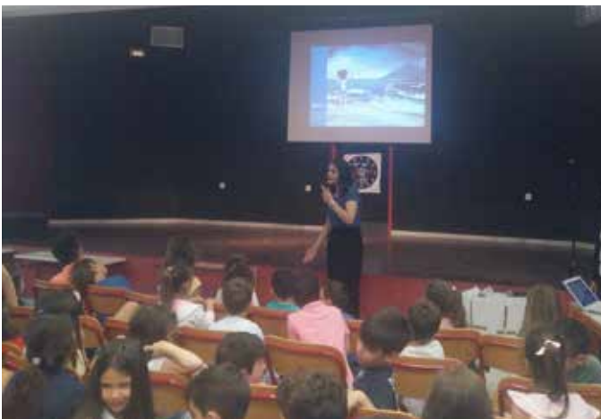
14ο ΔΗΜΟΤΙΚΟ ΣΧΟΛΕΙΟ ΑΧΑΡΝΩΝ