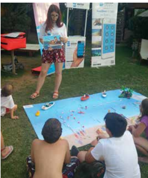
ΜΩΡΑΪΤΗΣ BEACH ΣΧΟΙΝΙΑΣ