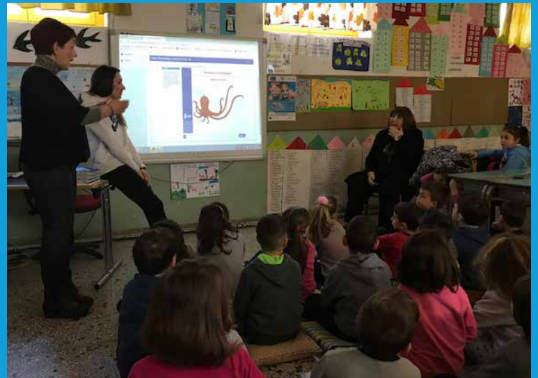
ΔΗΜΟΤΙΚΑ ΣΧΟΛΕΙΑ ΝΑΟΥΣΑΣ, ΗΜΑΘΙΑ