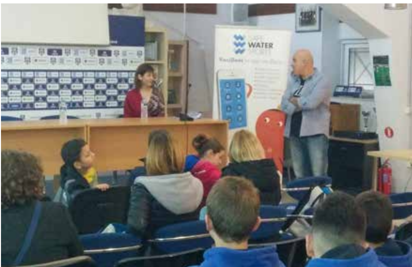
ΚΟΛΥΜΒΗΤΙΚΗ ΑΚΑΔΗΜΙΑ ΑΠΟΛΛΩΝΑ ΣΜΥΡΝΗΣ