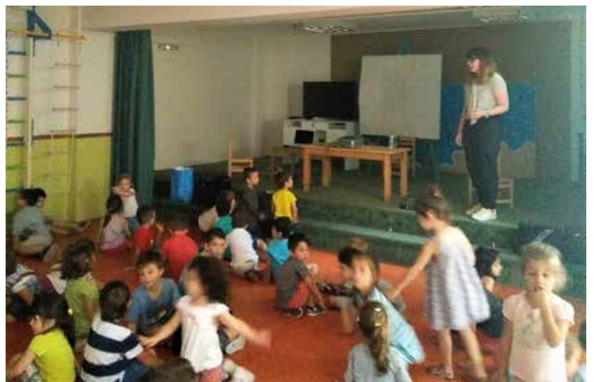
2ο ΔΗΜΟΤΙΚΟΣ ΠΑΙΔΙΚΟΣ ΣΤΑΘΜΟΣ ΡΑΦΗΝΑΣ