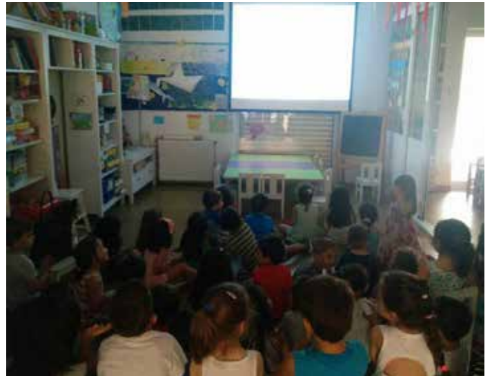
KINDER CLUB ΓΑΛΑΤΣΙ