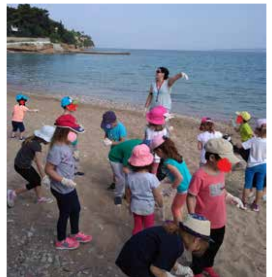
Το ΝΗΠΙΑΓΩΓΕΙΟ ΣΠΕΤΣΩΝ