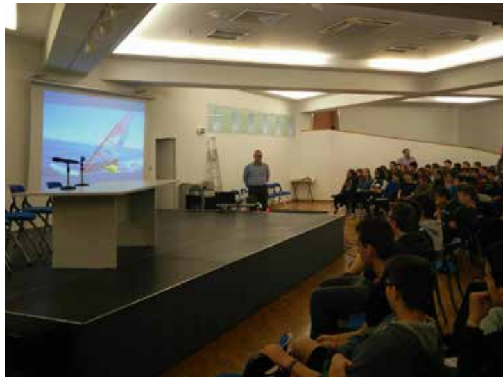
ΓΥΜΝΑΣΙΟ ΕΛΛΗΝΟΓΕΡΜΑΝΙΚΗΣ ΑΓΩΓΗΣ