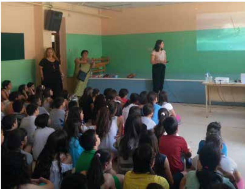
26ο ΔΗΜΟΤΙΚΟ ΣΧΟΛΕΙΟ ΝΙΚΑΙΑΣ