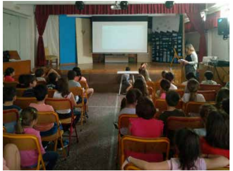
Το ΔΗΜΟΤΙΚΟ ΠΟΛΙΤΕΙΑΣ